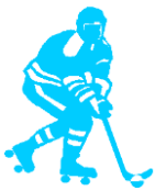
Confederación Sudamericana De Patín